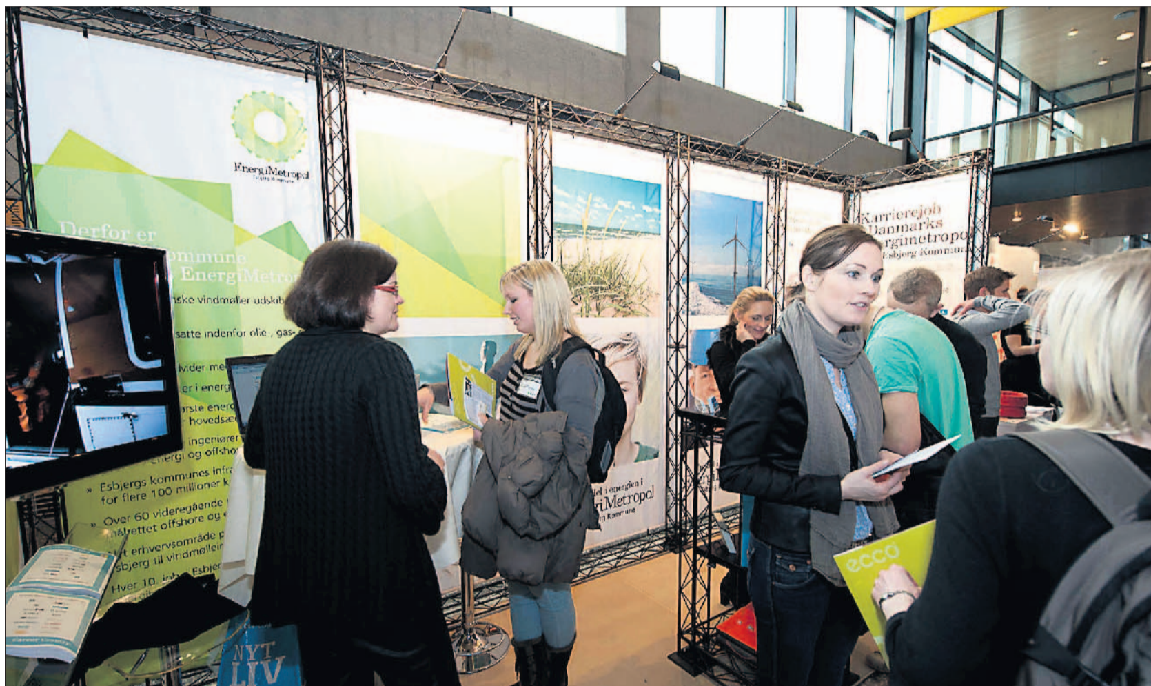
Interessen for Esbjerg var vakt hos de unge, som valgte at bruge dagen på årets karrieremesse på Syddansk Universitet i Odense.

– Jeg oplever, at folk bliver mere åbne, når de hører om mulighederne i Esbjerg. Der er en mental afstand til byen, som skal brydes ned, og